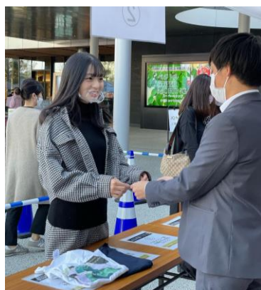
不要服回収の様子