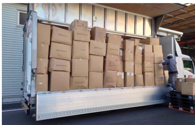
リサイクル工場への持ち込みの様子

日本環境設計が取り組むBRING™という、役目を終えた衣料品を地球の資源にリサイクルしている取り組みに賛同し、今回みなさまからご提供いただいた不要服 5,850着は12月初旬にアミュプラザくまもとから再生ポリエステル原料などにリサイクルされるため日本環境設計北九州響灘工場に届けられました。